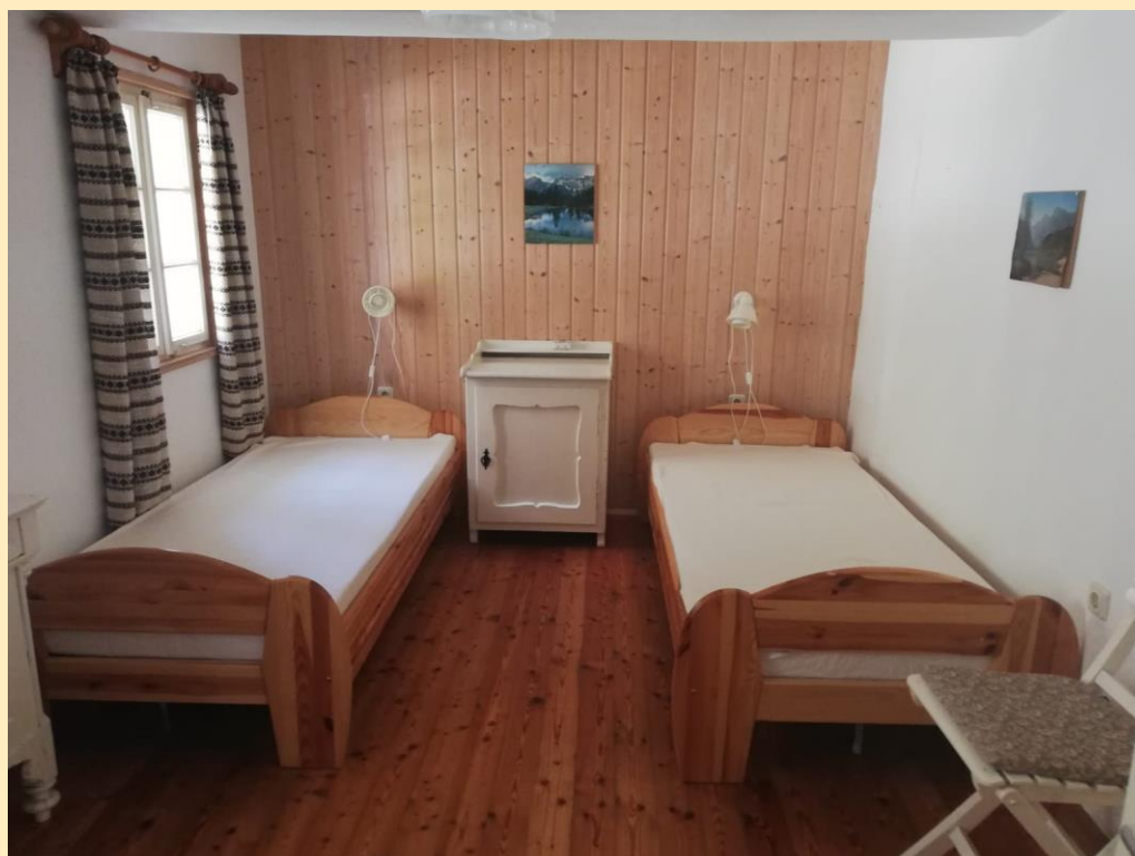
Zimmer 2 mit Einzelbetten