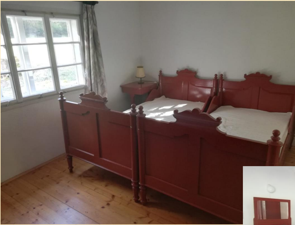
Zimmer 1 mit Doppelbett